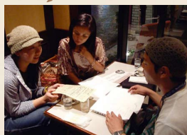
Connected Café イメージ

「Connected Café」は、「Connected」で扱ったテーマについてワールドカフェ風に参加者全員で語り合うイベントです。おいしいお茶を飲みながら一緒に未来のこと考えていきませんか？